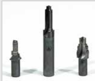
Herramientas para racores de latón. Tools for brass fittings.