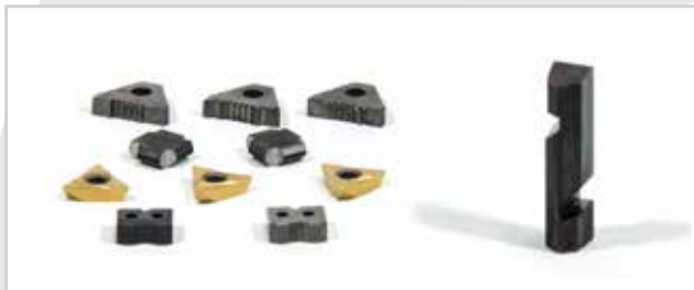
Plaquetas de widia perfiladas para todo tipo de aplicaciones y sectores. Profiled Widia inserts for all types of applications and sectors.