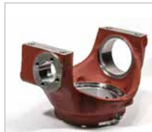
Portagrupo eje de camión. / Truck axle differential case. Sector de bloqueo. / Blocking section. Montaje de amortiguadores. / Shock absorber assembly. Biela. / Connecting rod.